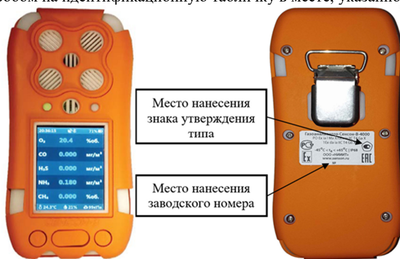
а) в оранжевом корпусе

Пломбирование и нанесение знака поверки на средство измерений не предусмотрено. Заводской номер в виде цифрового обозначения, состоящего из арабских цифр, наносится типографским способом на идентификационную табличку в месте, указанном на рисунке 1.