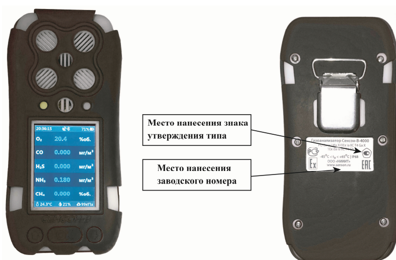
б) в черном корпусе