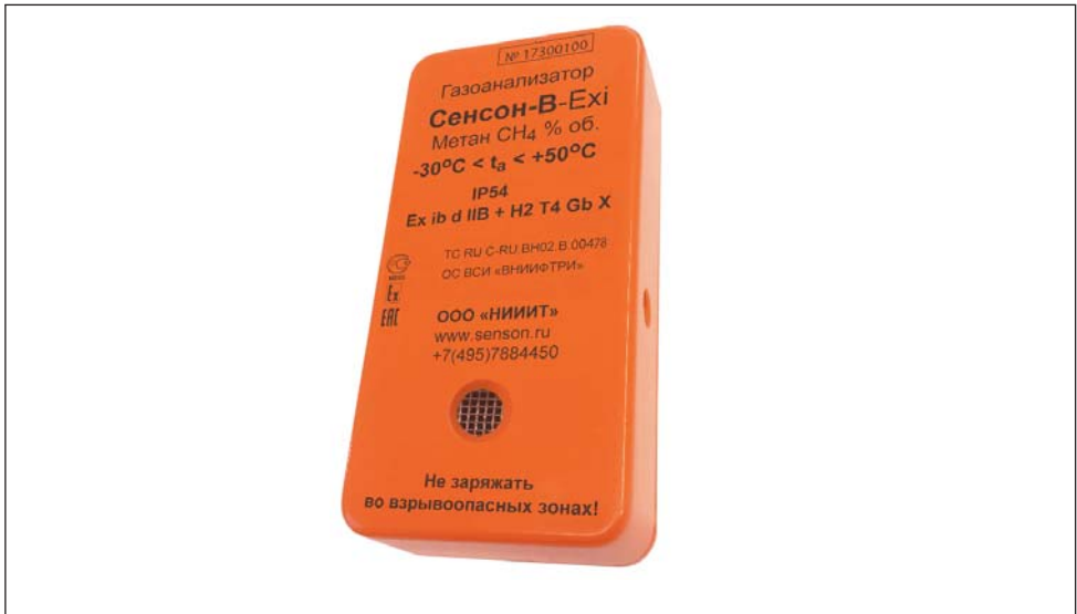
Рис. 2. Индивидуальный газоанализатор "Сенсон-В"

Автокалибровка происходит при включении прибора, при этом устанавливаются показания нормального содержания кислорода в атмосфере 20,9%.