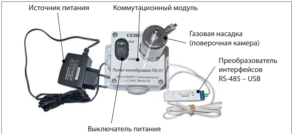
Рис. 1. Пульт калибровки ПК-01